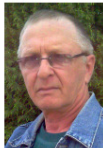
Вячеслав ПИЛЬЧЕНКО Сухой Лог «Азбука композиции» международный гроссмейстер